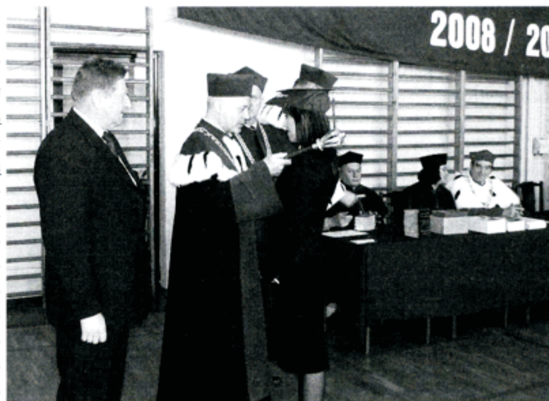
Studenci I roku otrzymują indeksy

Po tym głos zabierali goście. Poseł RP Tadeusz Sławecki omówił potencjał uczelniany Lubelszczyzny, podkreślił wzrost nakładów na szkolnictwo wyższe i pogratulo-