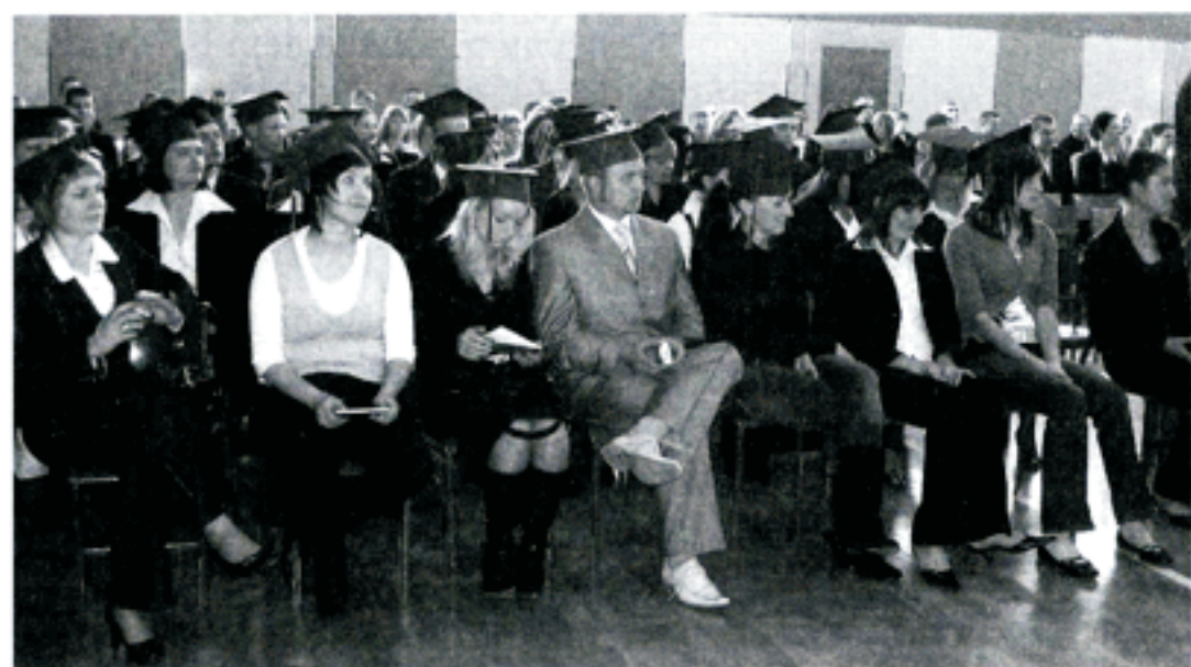
Studenci I roku WSBiA